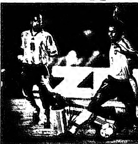
لعبت في المباراة التي جمعت بين فريقنا والبرازيل في بطولة كأس العالم (يونيو) الماضي